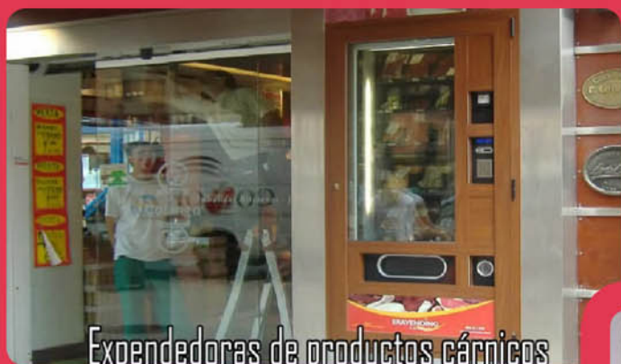
Exendedoras de productos cárnicos