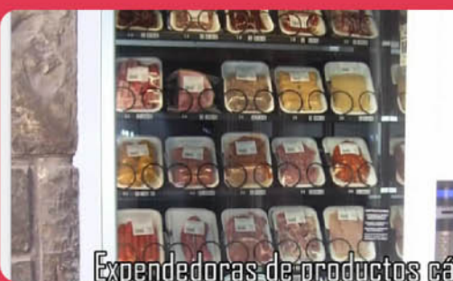
Exendedoras de productos cá